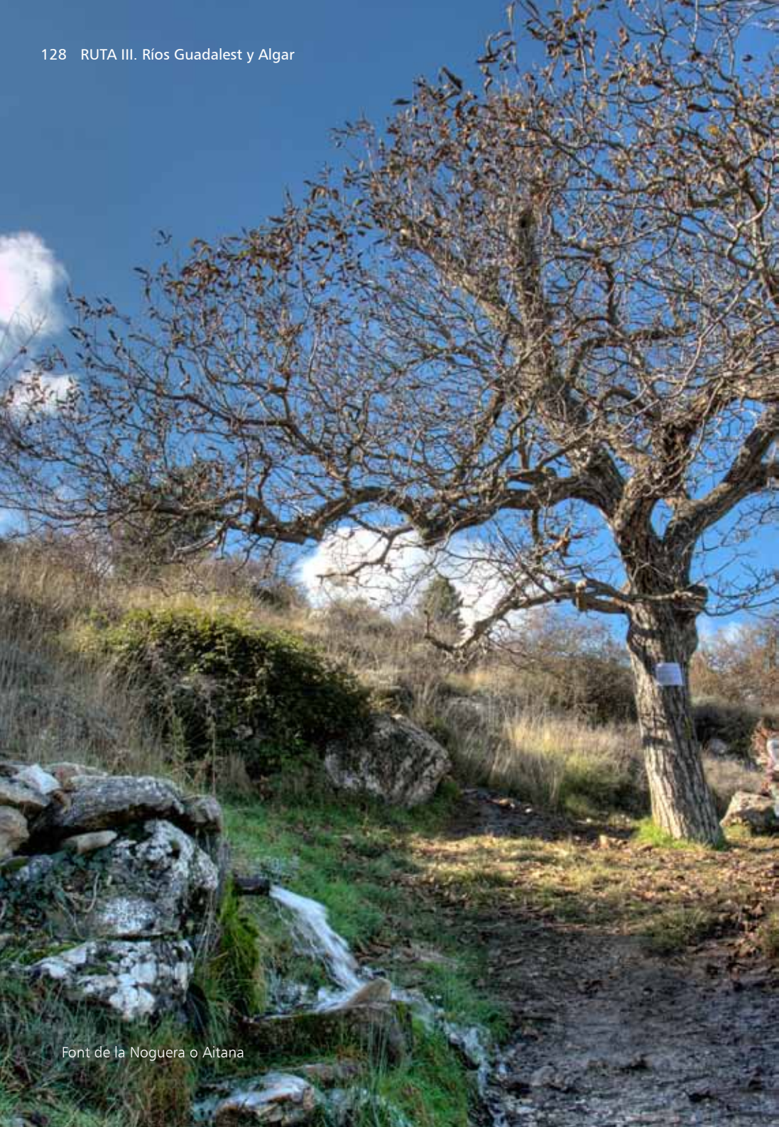
Font de la Noguera o Aitana