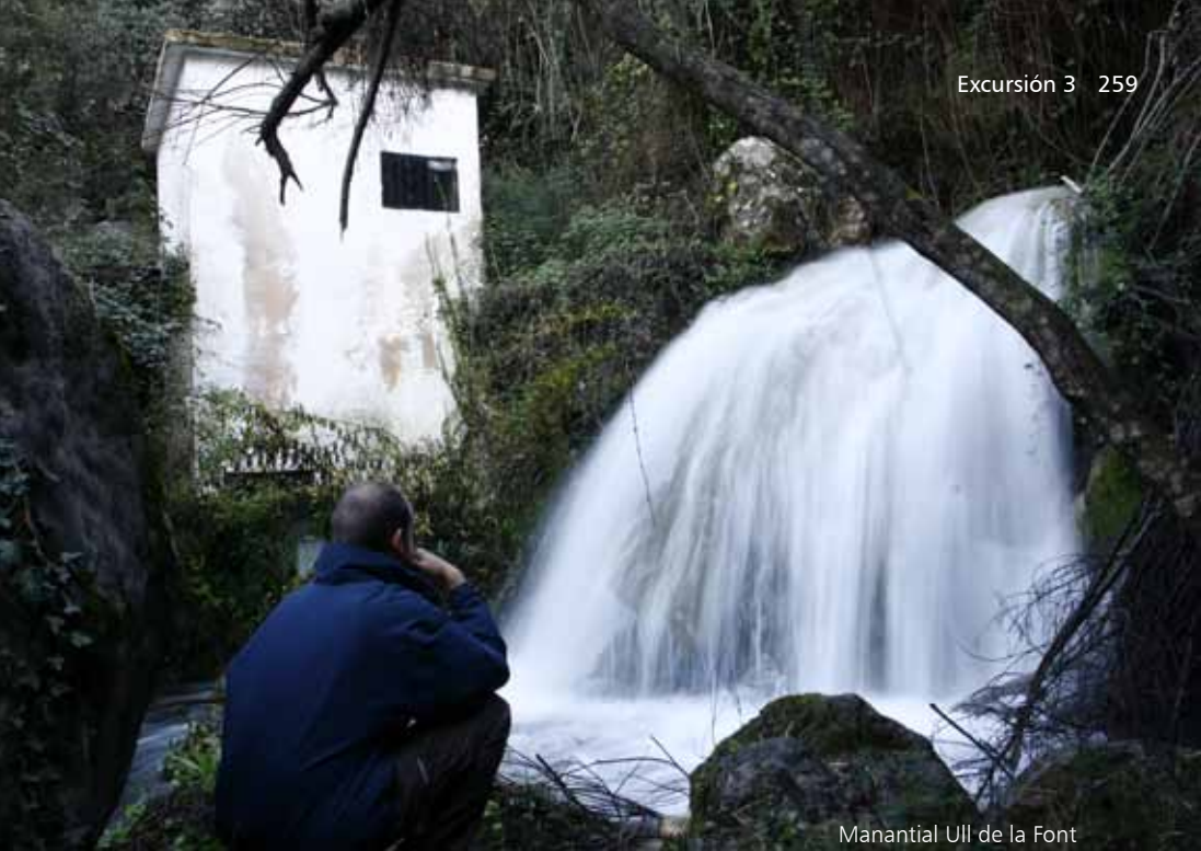
Manantial Ull de la Font

En un lateral del parque infantil, una escalera metálica desciende a otro rincón muy especial con un salto del río Frainós, denominado la Cascada de los Panamados. Es aquí donde muchas de las parejas de esta localidad han vivido sus primeros momentos de amor, y el entorno es muy agradecido para ello.