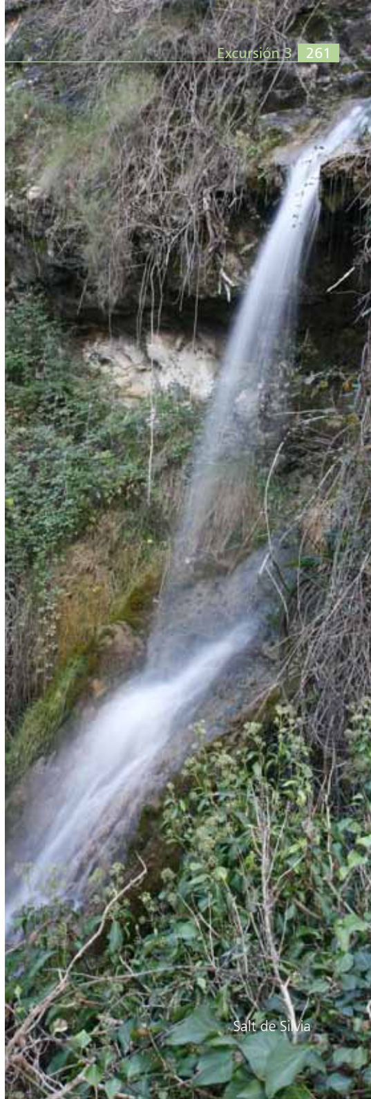
Salt de Silvia