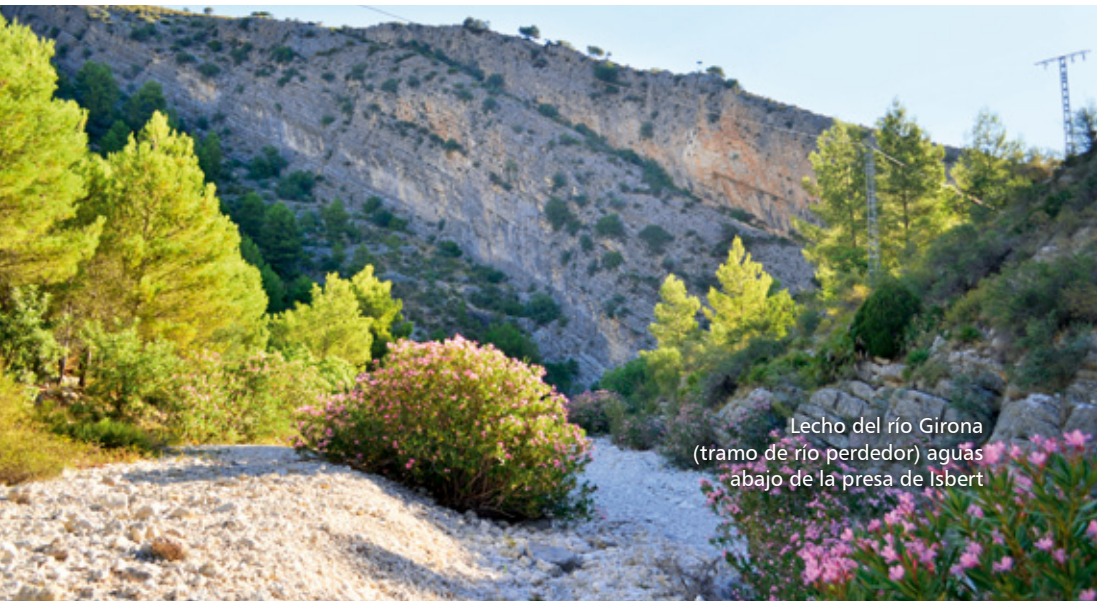
Lecho del río Girona (tramo de río perdedor) aguas abajo de la presa de Isbert

La presa nunca pudo utilizarse para regular el agua del río pues el agua retenida se infiltra totalmente en las calizas del acuífero Mediodía en pocos días.