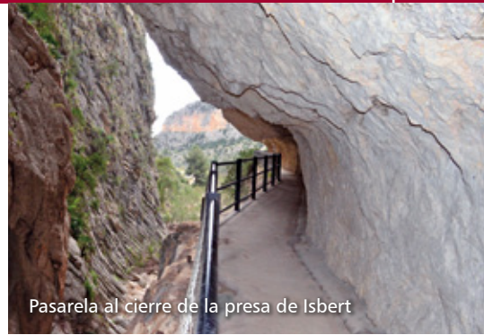
Pasarela al cierre de la presa de Isbert

Uno puede imaginar la fuerza que puede llegar a alcanzar el agua para mover los grandes bloques que de forma caótica tapizan el lecho de este río.